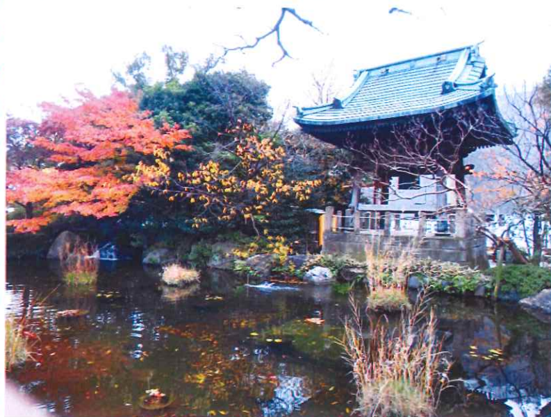
～西新井大師境内の鐘楼堂と池～

綺麗な紅葉ですね。今年は秋らしい秋も感じられず寒気がやってきたので、素敵な紅葉がみられて嬉しいです。